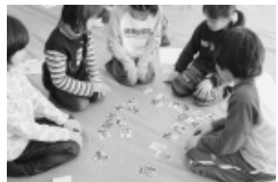
▲いろはがるた大会