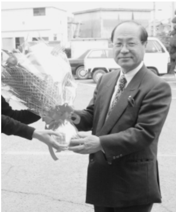
▲初登庁し花束を受け取る来馬町長

来馬町長は役場玄関前で、女性職員から手渡された花束を大きく掲げて新生・五色町を力強くアピールし、来馬町政をスタートさせました。