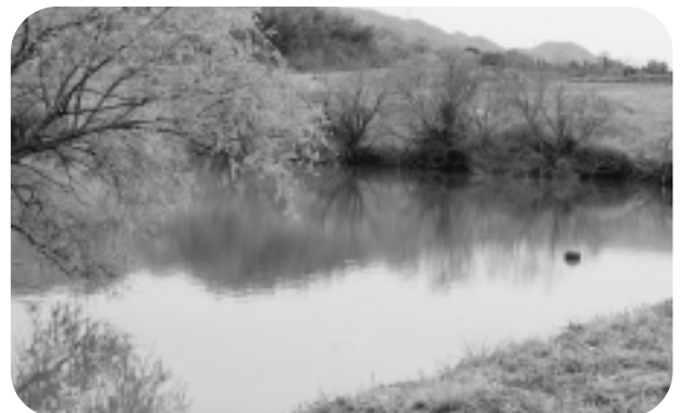
▲最優秀賞の菅ノ谷池