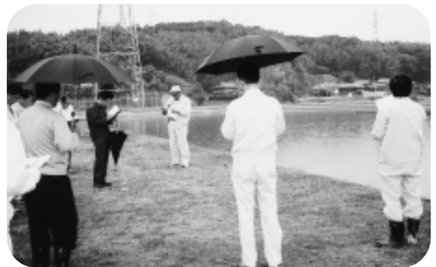
▲昨年のコンクールの様子