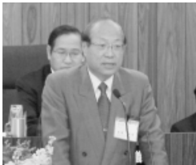
▲ 予算編成方針を説明する来馬町長