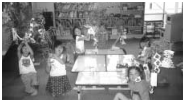
「七夕かざりをつくらう」