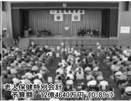
老人保健特別会計 予算額 12億4640万円 (0.8%)