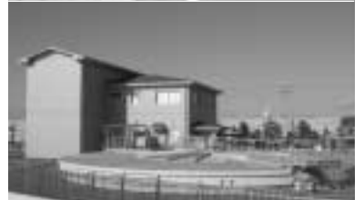
下水道事業特別会計 予算額 1億4840万円(10.4%)