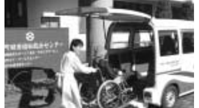
介護保険特別会計 予算額 8億2200万円 (7.3%)