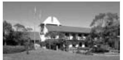
県民健康村健康道場特別会計 予算額 1億780万円 (7.8%)

予算でも県道、県河川を中心に11億円余の予算が投入されます。 ②共生の里の推進 地域がともに支え合いながら、住み慣れたまちで、安心して生活できる環境をめざす地域づくりを地域と共有すること、そのための仕組みづくりを研究します。特別養護老人ホームに20床の増床を計画します。 ③公共交通対策 路線バスの確保は、交通弱者対策にとどまらず、観光や交流の面からも重要なイン