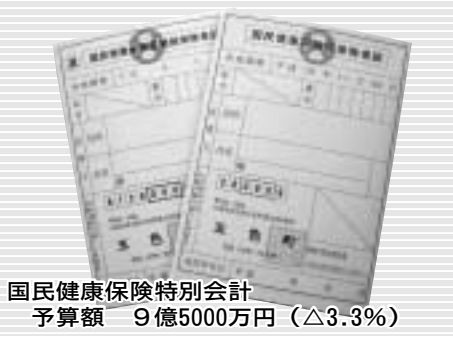
国民健康保険特別会計 予算額 9億5000万円 (△3.3%)