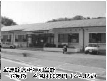
鮎原診療所特別会計 予算額 4億6000万円 (△4.8%)