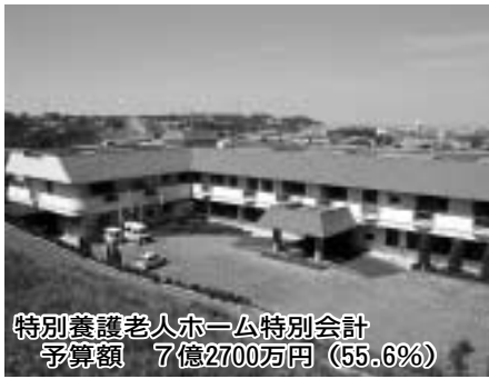
特別養護老人ホーム特別会計 予算額 7億2700万円 (55.6%)