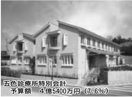
五色診療所特別会計 予算額 4億5400万円 (7.6%)