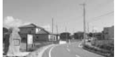
土地取得造成特別会計 予算額 6億1000万円(△19.7%)