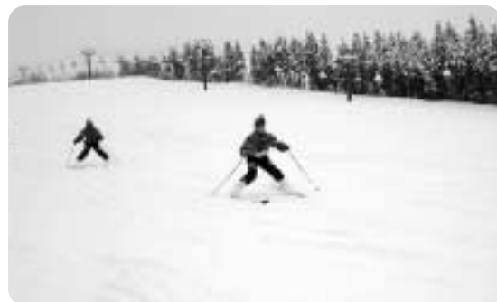
▲恐る恐るボーゲンで斜面を…