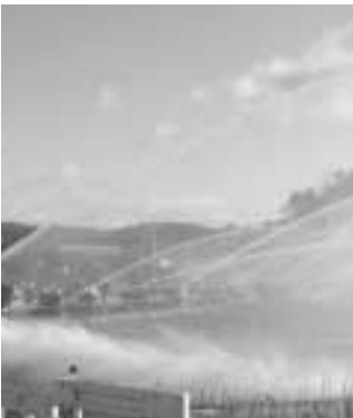
一斉放水する消防団員(西谷池)