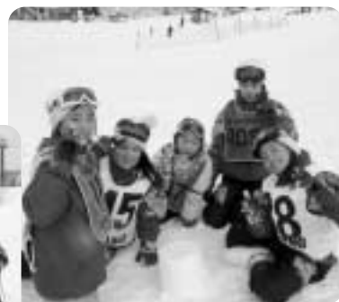
▲ゲレンデで交流を深める子どもたち