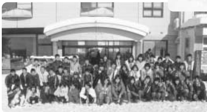
▲参加した47人の子どもたち