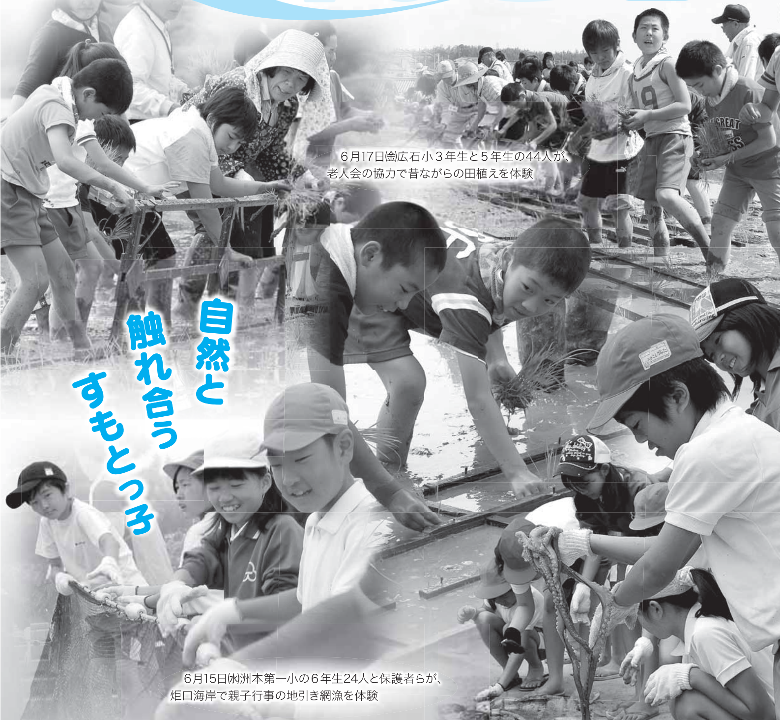
6月17日(金)広石小3年生と5年生の44人が、老人会の協力で昔ながらの田植えを体験