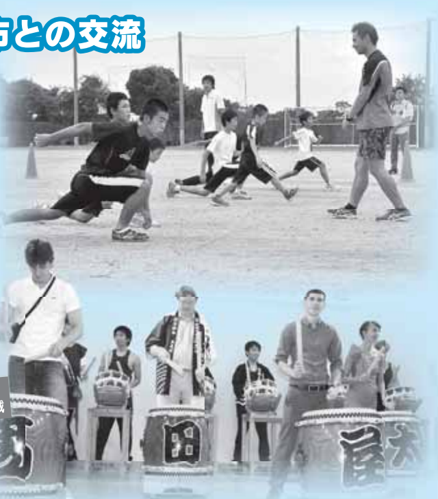
3月号・7月号 8月号・10月号に掲載

徳島県美馬市(旧脇町)からは、子ども37人が「キッズドリームスポーツチャレンジinすもと」に参加し、すもとっ子とスポーツ交流をしました。また、行政間では、2月に大規模災害発生時の物資提供や職員を派遣する相互応援協定を締結しています。