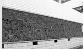
家庭部門最優秀賞作品