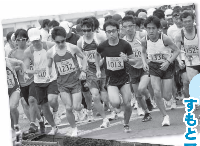
合併5周年記念事業 すもとマラソンが開催!

一方、市内でもさまざまな出来事があり、その中から本紙や新聞各紙掲載された市政をめぐる動きから、本市の主要なニュースをまとめました。