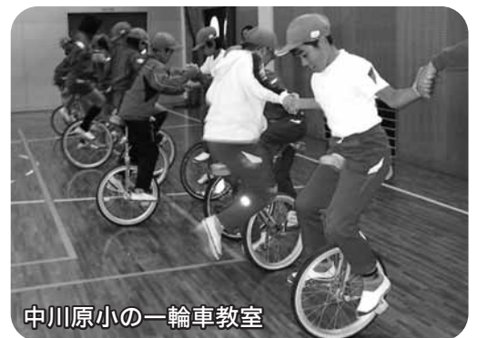
中川原小の一輪車教室