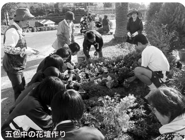
五色中の花壇作り

生徒たちは、自分たちが頑張った花壇を見て心が和んでくれたら嬉しいと、笑顔で花を植えています。