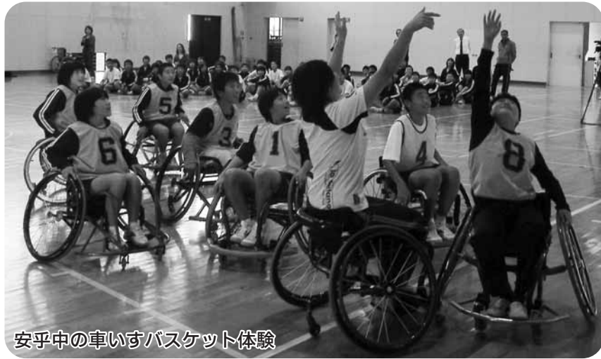
安乎中の車いすバスケット体験

いる菜の花エコプロジェクトを学び、環境問題に取り組む学校（都志小）、教習所で行う自転車の安全教室（青雲中）を行っている学校もあります。また、外部講師に落語家を招いての人権学習（由良中）や、美術館の職員による