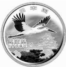
千円貨幣(銀貨) (直径40mm)