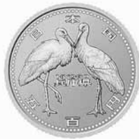
500円貨幣(直径26.5mm) ※金融機関窓口で平成25年1月頃に500円と交換となります。