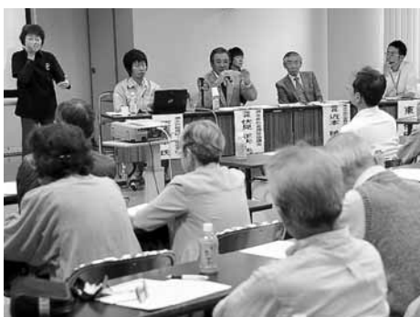
「災害にも強いまちづくりフォーラム」

防災や減災は、日頃の備えが重要です。市では、さまざまな備えに対する取り組みを支援すると共に、防災訓練などを通じて、防災意識を高めたいと考えています。