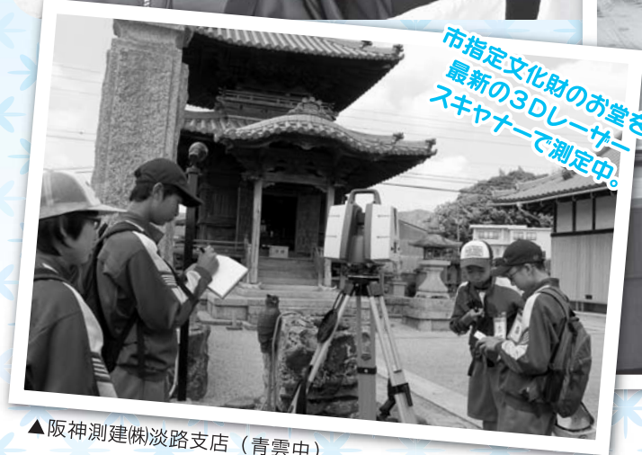
市指定文化財のお堂を、最新の3Dレーザースキャナーで測定中。