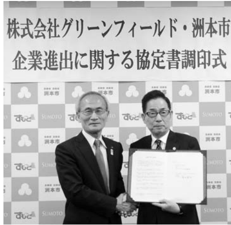
株式会社グリーンフィールド・洲本市 企業進出に関する協定書調印式

3階建てのホテルや別荘などを建設し、平成34年に第1期開業を、37年に本格オープンを目指しています。