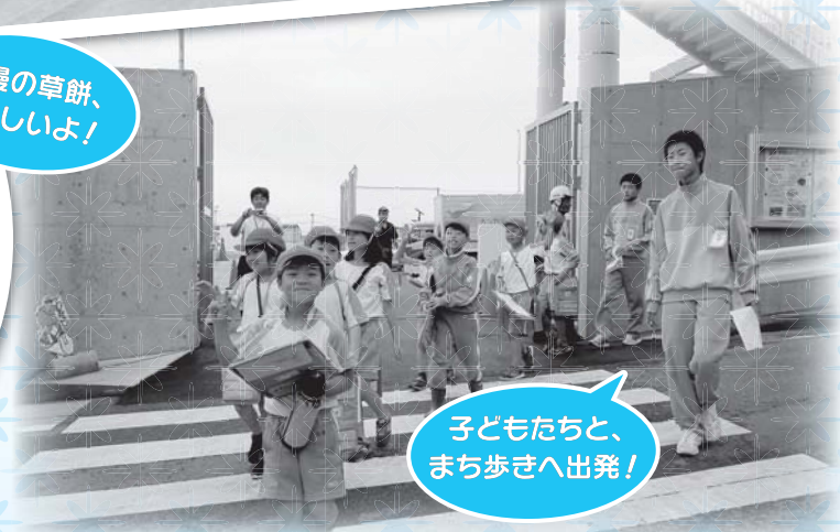
なが井製菓▶ (五色中)