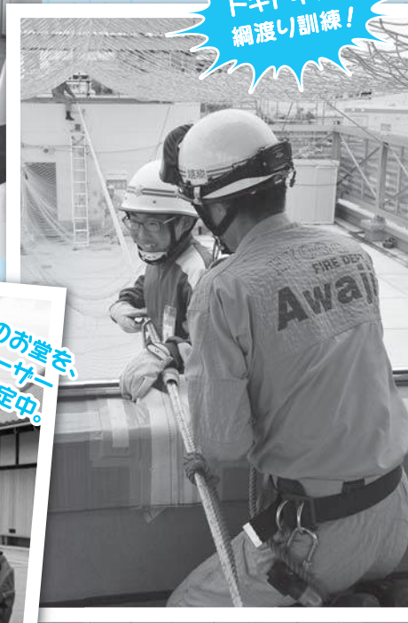
ドキドキの綱渡り訓練！