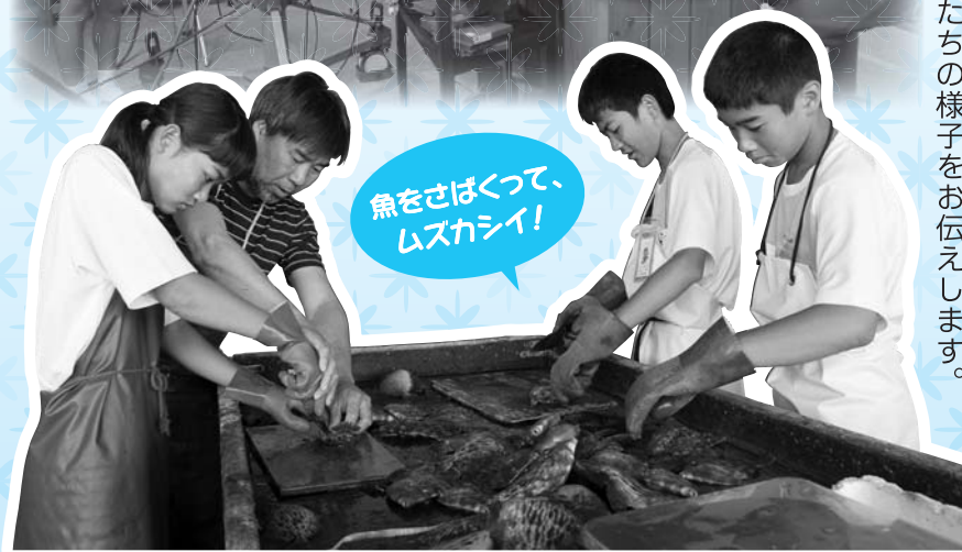
魚をさばくって、ムスカシイ！