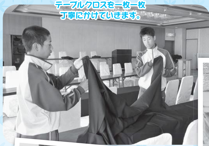
テーブルクロスを一枚一枚丁寧にかけていきます。