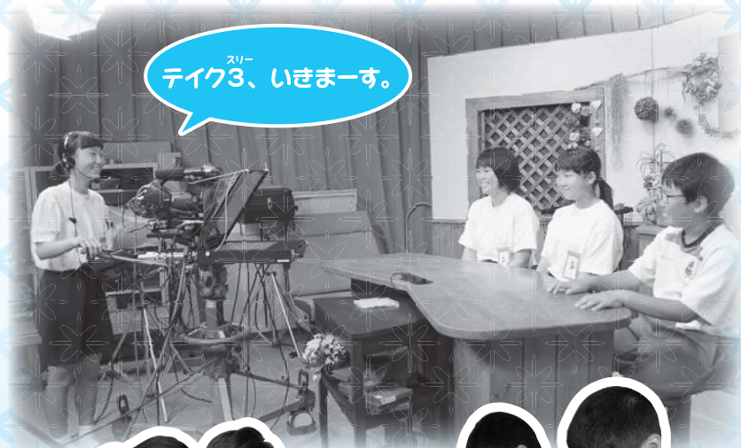
スピーチク3、いきまーす。