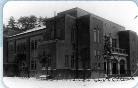
第18回(昭和40年)まで会場となった洲本市公会堂