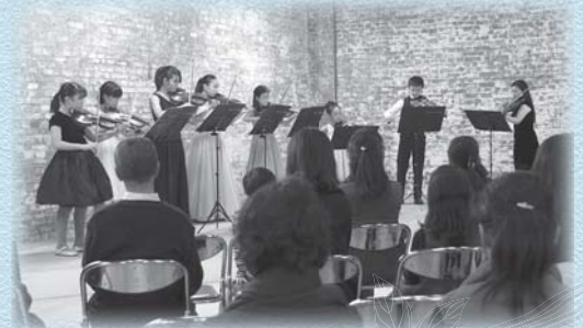
ギャラリートコンサート

最優秀賞をいただき、驚きと喜びでいっぱいです。作品展に応募するために、1枚1枚思いを込めて書きました。高校に進学しても書道部に入り、いつか書道パフォーマンス甲子園に出てみたい。もっと上達したいです。