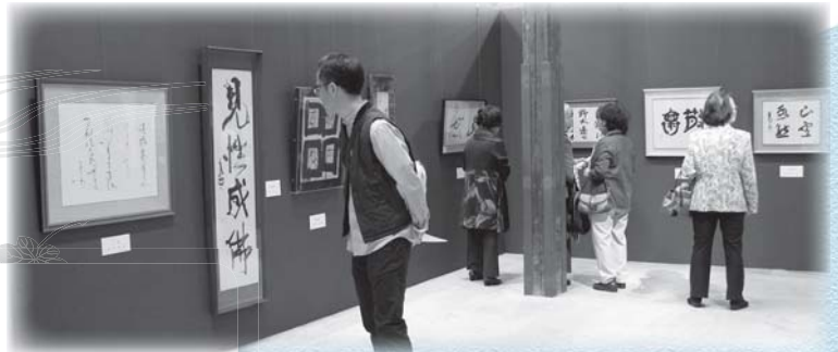
▶ 市展ゆかりの作家作品展