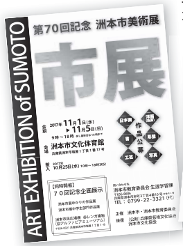
第70回市展ポスター(左)と目録(右)

11月1日(水)から5日(日)までの5日間、市文化体育館で一般公開され、さらに今年は節目の年にあたることから、これを記念し、洲本市民広場横赤レンガ建物(旧アルファピアミュージアム)において、「資料に観る市展のあゆみ」「市展