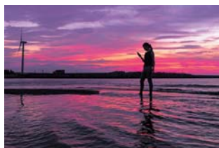
最優秀賞「染まる空と海」

2月18日(日)、同コンテストの表彰式が市役所五色庁舎でありました。今年も、島内外より50作品の応募があり、最優秀賞など7作品が入選しました。