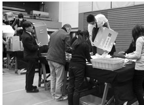
▲開票作業の様子(3月11日(日)、市文化体育館で)

今回の市長選挙は当日の有権者数が3万7905人(男1万7804人、女2万1011人)。投票終了時の午後8時までに、有権者の59・63パーセントにあたる2万2603人が投票を行いました。