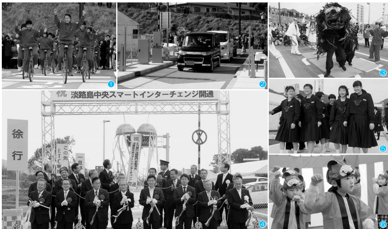
① 中川原小児童による一輪車通り初め ② 上り線での走り初め ③ 市原町内会による獅子舞 ④ テープカットとくす玉割りで開通を祝う関係者の皆さん ⑤ 来場者通り初め(写真は式典で演奏を披露した洲浜中吹奏楽部の皆さん) ⑥ 中川原保育所園児による「四季の八狸」踊り

同スマートICは、24時間・上下線両方向利用可能。今後、観光や企業誘致など多方面にわたる整備効果が期待されます。