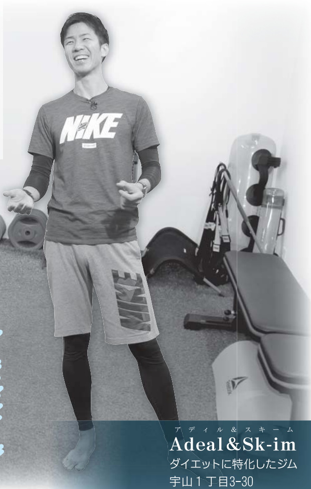
アディル & スキーム Adeal & Sk-im ダイエットに特化したジム 宇山1丁目3-30