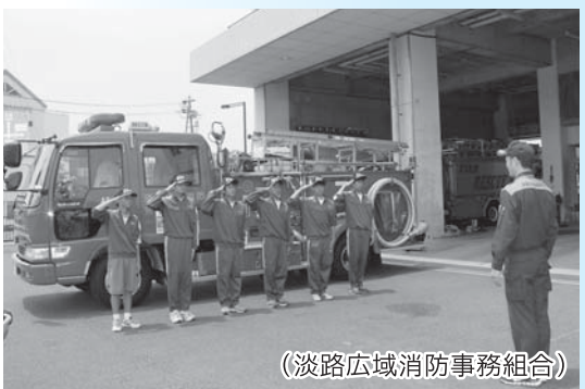
(淡路広域消防事務組合)