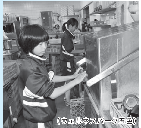
(ウエルネスパーク五色)