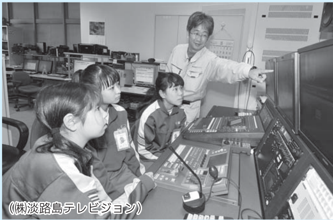
(株)淡路島テレビジョン