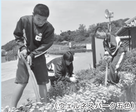
(ウエルネスパーク五色)