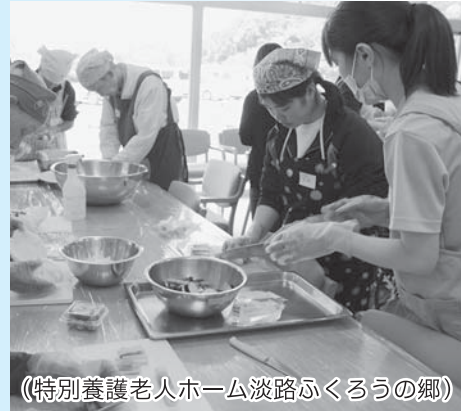
(特別養護老人ホーム淡路ふくろうの郷)