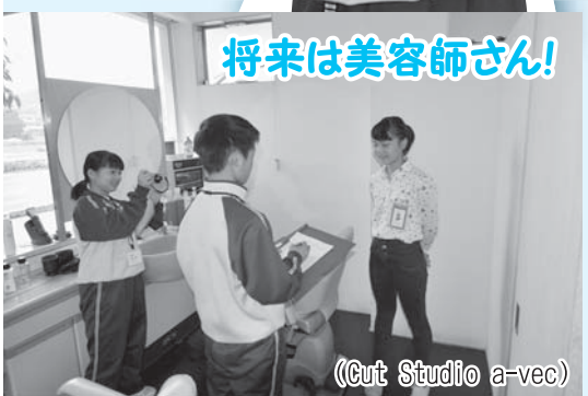
将来は美容師さん!