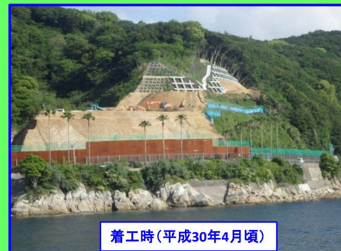
着工時(平成30年4月頃)