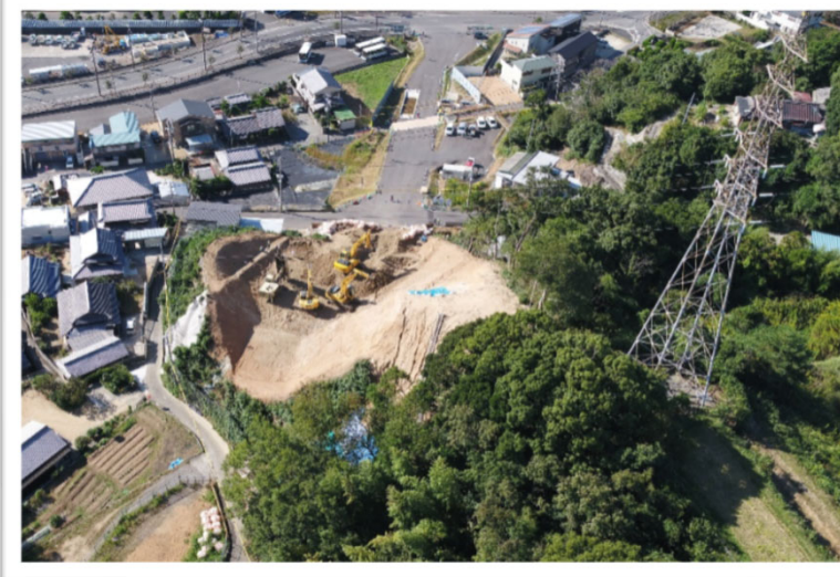
愛宕線からの航空写真です。工事用道路 の線形が少しわかりやすくなりました。