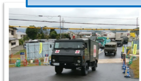
洲本実業高校で行われた避難訓練に向かう自衛隊の車 両に盛土区間の道路を開放し、通行してもらいました。

発注者：国土交通省近畿地方整備局 兵庫国道事務所 洲本維持出張所 ☎0799-22-1680