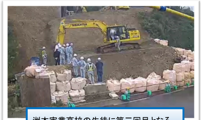
洲本実業高校の生徒に第三回目となる 現場見学会を実施しました。