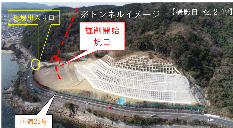
洲本市炬口側海岸線より宇山地区方向を望む