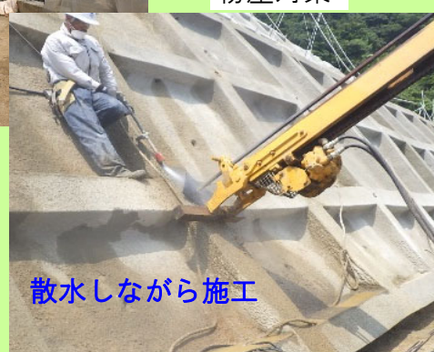
散水しながら施工