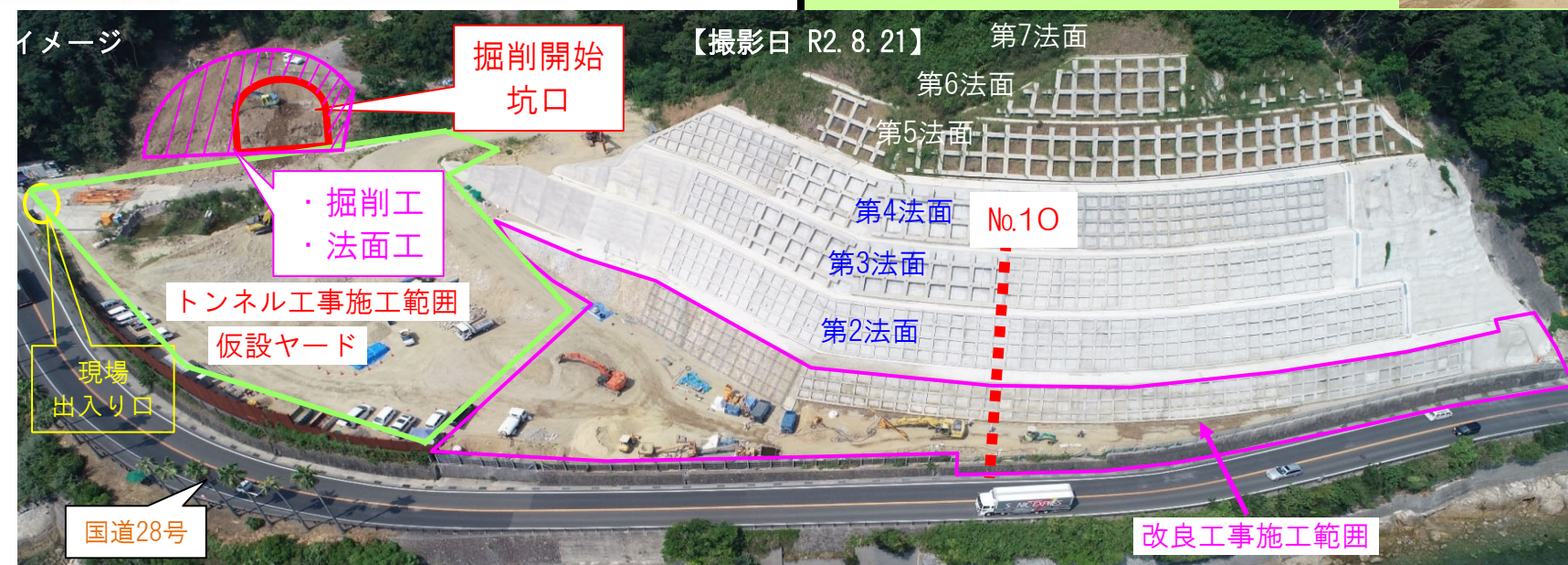
【撮影日 R2.8.21】 第7法面