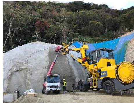
掘削補助工施工状況