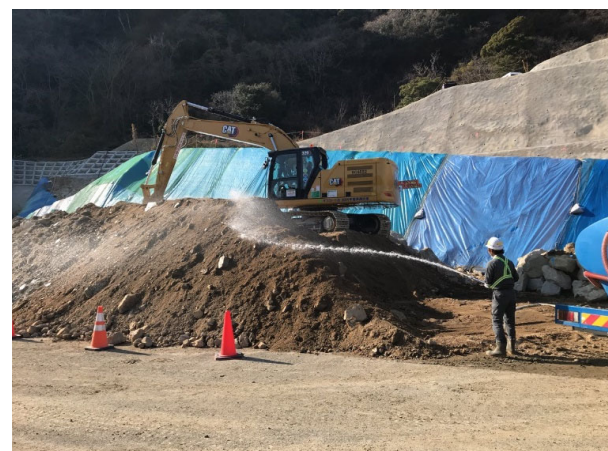
残土処理工（防塵・飛散対策） 散水状況