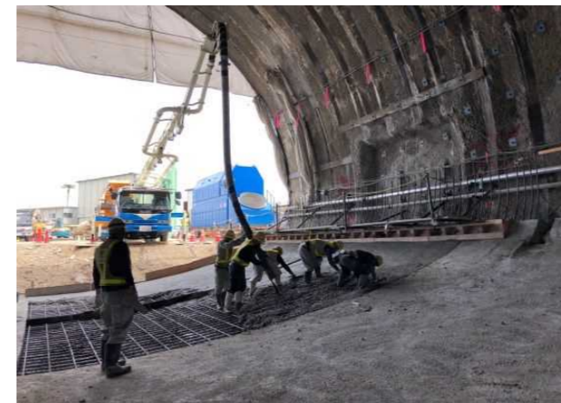
コンクリート打設（インバート工）状況