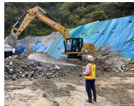
残土処理工（防塵、飛散対策） 散水状況