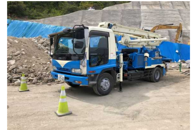
インバート使用機械 コンクリートポンプ車 最大長さ15.6m (ミキサー車で運搬した生コンクリートを打設箇所に圧送します)