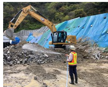
残土処理工（防塵、飛散対策） 散水状況