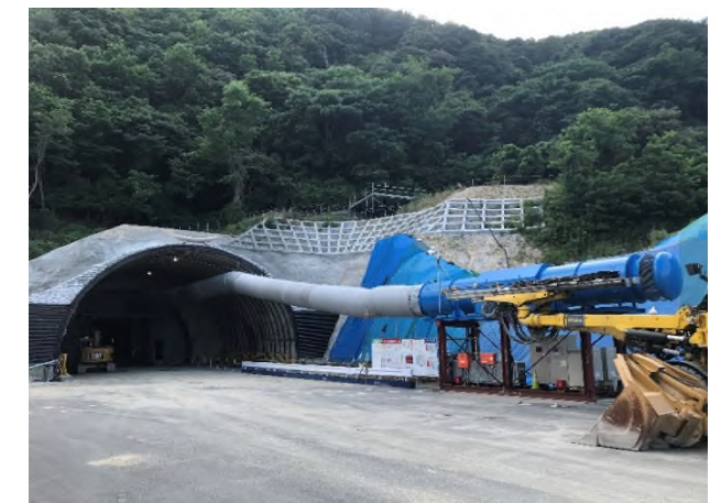
トンネル掘削 使用機械 送風機 (坑外から新鮮な空気を坑内に送り、坑内環境を快適にします。)