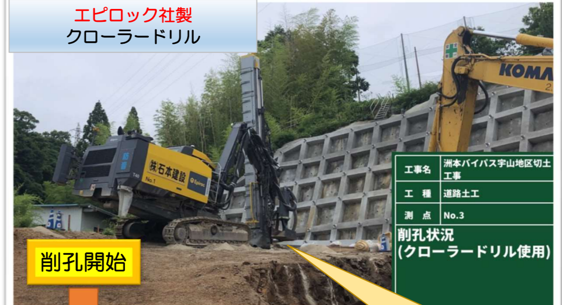
エピロック社製 クロードリル