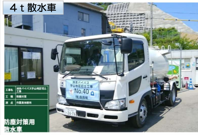
4 t 散水車