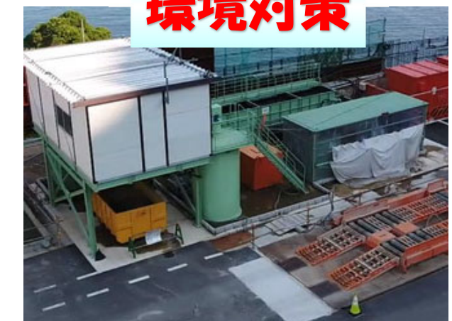
仮設備工 濁水処理設備

坑内で発生した全ての濁水は、濁水処理設備において海域の排水基準を満足するように処理してから排水しています。