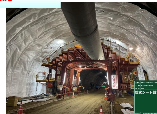
防水シート設置状況