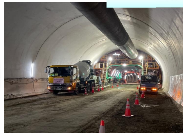
覆工コンクリート打設