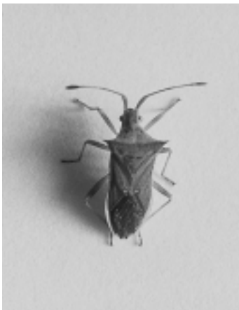
ヒメハリカメムシの成虫