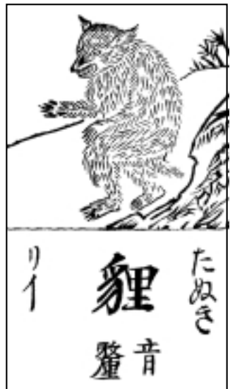
たぬき 狸 音 りい わ かん さん さい す え 倭 漢 三 才 図 会 より 江戸時代の図説百科事典

られていました。それは、洲本の町の周辺に豊かな森をもった里山があり、また町中でも所々に屋敷森や城下町を巡る松並木があつてある程度狸の生息しやすい環境にあつたこと、夜行性の動物である狸が夜になると自由に出来る暗闇があり、また、人家の周辺には食べ残しが放置されたり、