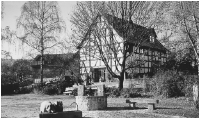
フルダ市郊外・ピスカス村 (農村コンテスト優勝の対象となった景観の一つ)