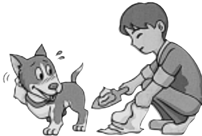
ペットのフンは持ち帰ろう

ポイ捨てを防ぐため、家の周辺は美化に努め、ポイ捨てができてにくい環境づくりをしましょう。