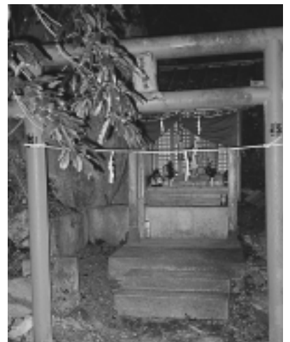
三熊山にある八王寺神社の横で祀られている柴右衛門狸

本来の神様はなく、唯その神通力を信じられたり、祟りを恐れられたりして祀られているようである。狸と人の関わりはだいたい三段階があるようである。