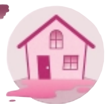
水ぬれ損害 (消火に伴う水ぬれなど)