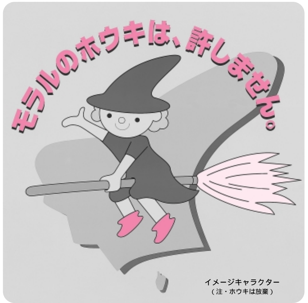
イメージキャラクター (注・ホウキは放棄)