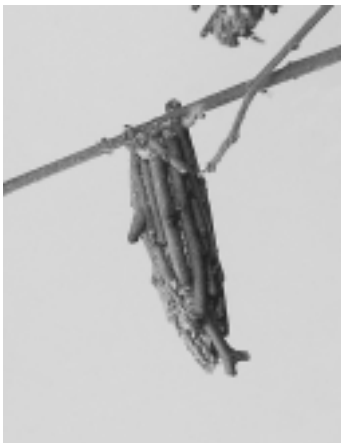
冬を越すチャミノガ