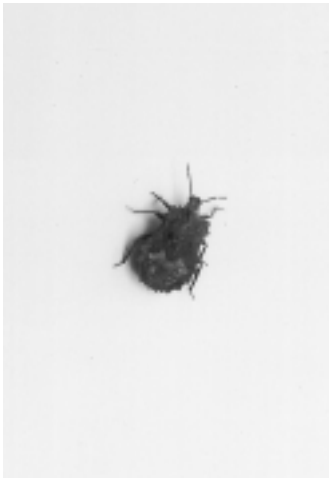
ノコギリカメムシの成虫