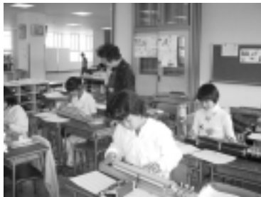
大 正 琴