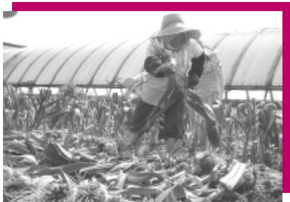
収穫は田植え前の忙しい合間に行います。

「池田ジャンボにんにくの会」は、池田の酪農家の主婦の集まりで、生活改善グループとして平成10年に発足しました。同会では、地元の産業の振興のために、無臭で健康食として人気の高いジャンボにんにくを育て、焼肉のタレを作っています。おいしい焼肉のタレができるまでを紹介します。