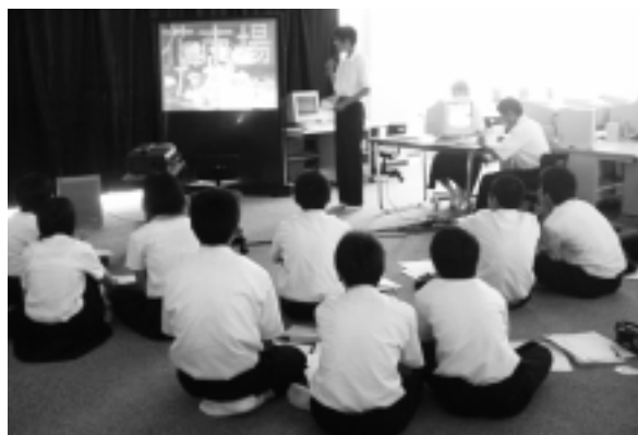
（トライやる・ウィーク報告会に向けて）

2年 トライやる・ウィーク発表会で見ていただくプレゼンテーションの作成 （事業所での活動の様子や一人一人の感想など）