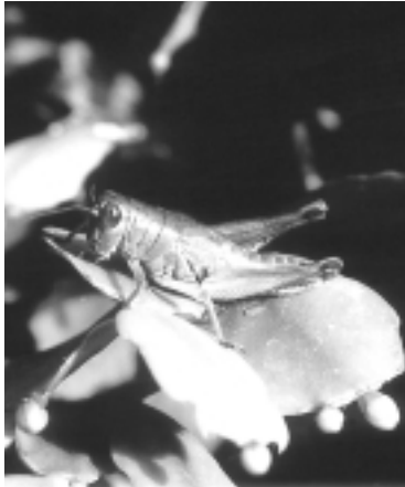
セトウチフキバッタの成虫