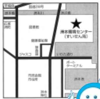
下水道マスコットキャラクター スイスイ

とき 9月7日(日) 午前10時~午後4時 ところ 洲本環境センター 「すいせん苑」(塩屋1 1 4 駐車場あり) 詳しくは、市役所都市整備 部下水道課(☎22・332 1内線335、336)へ。