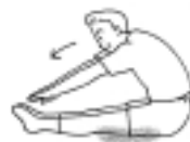
腰部・ハムストリング

のペースでしてみましょう。 ◆ストレッチ体操のポイント ▽ゆったりとしたリズムで、一、二、三と数えながら十〜二十秒は同じ姿勢を保つ。 ▽反動や弾みをつけない。 ▽お風呂あがりなどの体が温まっているときに行うのが効果的。