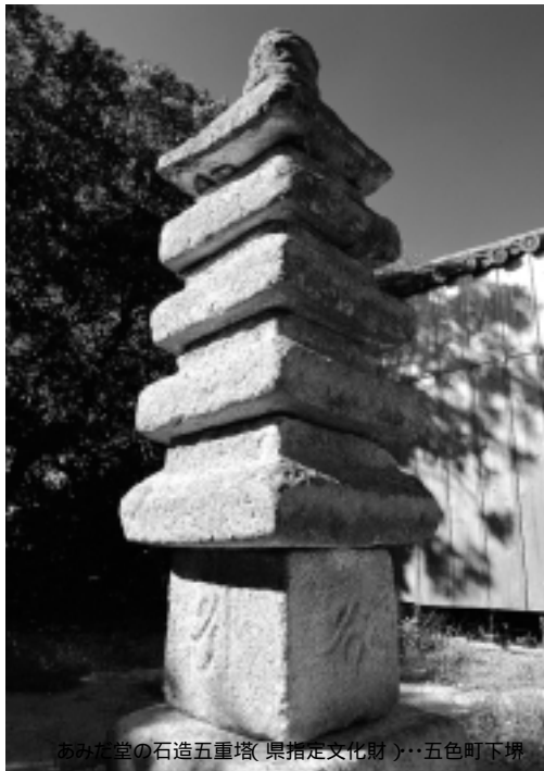
あみた堂の石造五重塔(県指定文化財)・五色町下堺