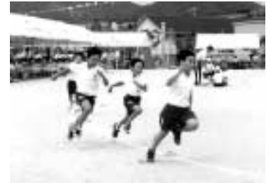
ゴールをめざして、がんばれ