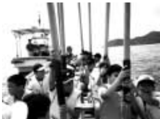
力を合わせてこいだカッター訓練