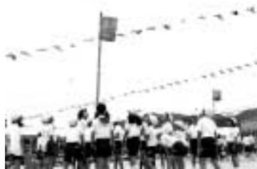
よくねらって、そーれ