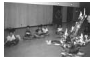
スタンプやゲームを楽しんだキャンドルサービス