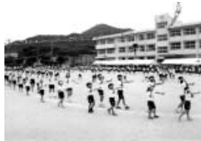
みんな輪になって仲良く加茂小音頭