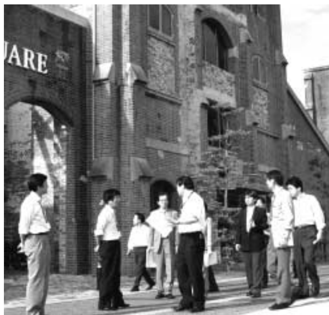
市内を視察する都市再生戦略チームのメンバー

ITを産業や商工観光施策に、どのように生かすか ITに対する評価をどのようにするか などの課題が出てきています。