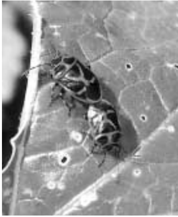
ペアで行動するナガメ