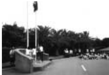
他校との交流の場、朝夕のつどい

5年生が、6月4日から9日までの6日間南淡町の淡路青年の家で自然学校を行いました。6日間家族と離れて生活するのは初めての体験でした。しかし、時間がたつにつれ集団での生活や指導補助員のお兄さん・お姉さんにも慣れて、楽しく活動ができました。この集団生活の体験は、これからの生活にきっと生かされることと思います。