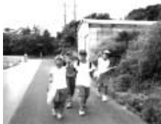
グループごとに山上まで上ったホステリング