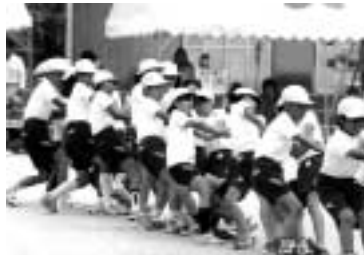
力を合わせて オーエス