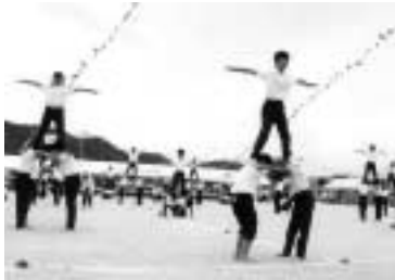
おみごと きれいにきまったよ

綱引きや玉入れなど紅白に分かれての演技、またダンスや組体操などの学年の演技など、子どもたちの元気いっぱいの演技にあたたかい声援が運動場に鳴り響いていました。