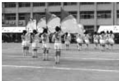
体育会の華、吹奏楽のマーチング