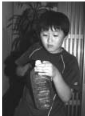
びんやペットボトルの資源ごみは、地区の拠点回収へ。

各家庭から出された燃えるごみは緑町にある「やまなみ苑」で焼却され、灰は大阪湾広域臨海環境整備センター（フェニックス）で埋め立て処理されます。