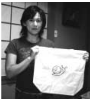
買い物時はマイバッグを持参、レジ袋はもらわないようにしています。