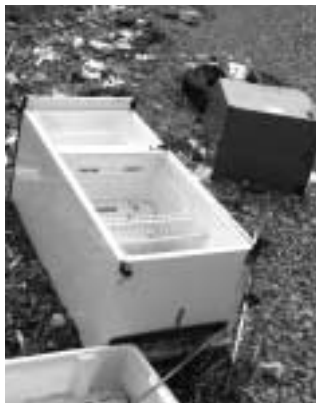
海岸に捨てられた冷蔵庫

ごみを決められた方法以外で捨てると『不法投棄』となり、法律により『五年以下の懲役又は一千万円以下の罰金、若しくは両方の刑』に処せられますので、絶対に捨てないでください。