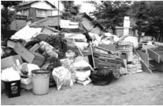
これまでの春・秋の大掃除は毎月1回の大型ごみの回収に

本市のごみ処理量は、平成元年度の一万余八千八百五十七トをピークに、資源ごみ集団回収の奨励や生ごみ減量化補助金の施策などにより、ほぼ横ばいで推移してきました。指定ごみ袋制度が導入された六年度では、