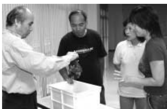
分別されずに解けたアルミニウム。機械の故障の原因となりますので、しっかりと分別お願いします。

「ごみ有料化は、全国的にみても実施の自治体が増えつつあります。この目的は、分別収集の促進と、負担の公平化という観点があります。資源として、しっかりと分別し、ごみの減量化に取り組む人と、そうでない人の区別化を図ることになります。環境問題は、避けて通れない非常事態となっています。家庭や企業で行われている、ごみ減量の取り組みを紹介します。」