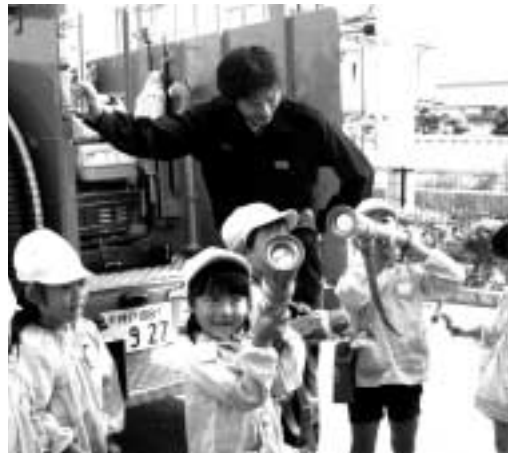
平常時には地域内の幼稚園児とも交流を図ります