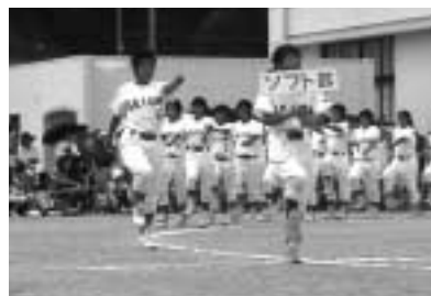
ソフト部、堂々の行進