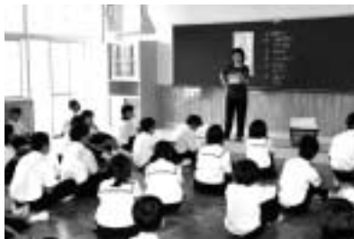
きれいに使おうね