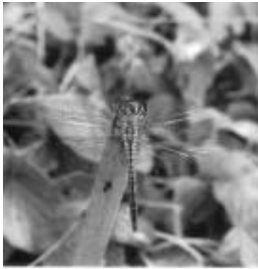
羽を休めるウスバキトンボ