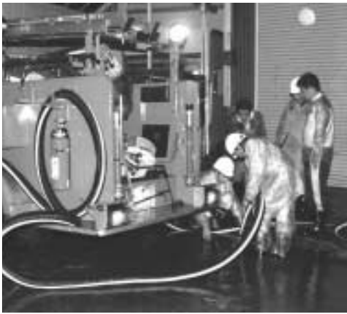
災害時には、排水作業や土のう積みにも活躍します