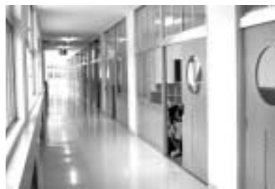
ローカもピカピカ

本校は今年度から3年かけて改修工事をおこないます。 今年度は本館東側部分がきれいになりました。