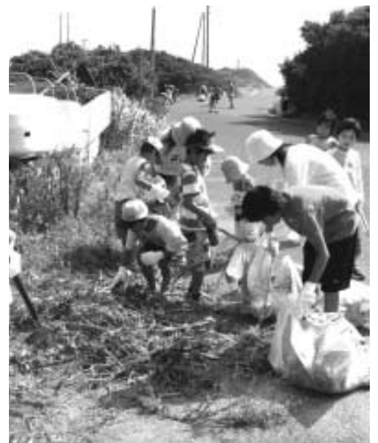
拾っても拾ってもごみはなくなりません

指定ごみ袋は、来年七月から十八年三月までの九か月分を無料配布します。ただし、新制度の移行期間として十八年九月末までは、