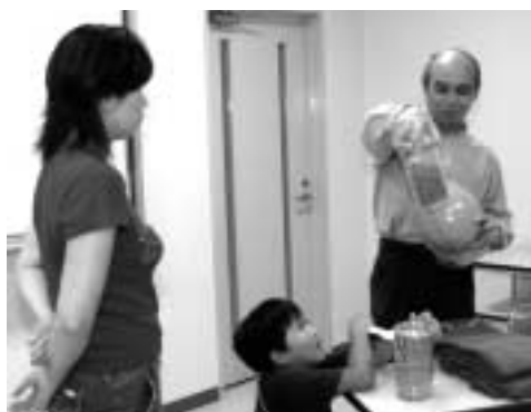
固められた灰の見本。集じん灰は、固められ神戸沖の処分地で埋め立てられます。燃やしたごみの約9割が灰になります。