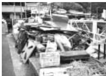
大掃除に出された建築廃材・宇原

不法投棄は見逃しません ごみの不法投棄を目撃したら 直ちに110番へ 不法投棄が後を絶ちません。公園や道路など、捨ててはいけない場所、冷蔵庫やテレビなど、捨ててはいけないものが、捨てられています。また、今年の春の大掃除中にも建築廃材などが不法に捨てられています。その後も金屋、中川原地区などで不法投棄が多発しています。不法投棄の現場を目撃されましたら、直ちに洲本警察署（☎22・0110）に通報してください。不法投棄を未然に防ぐために、皆さんのご協力をお願いします。