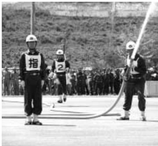
県消防操法大会（小型ポンプの部）で淡路勢で初めて三位に入賞

今年、日本列島に上陸した台風の数が増え、まさに台風のあたり年となりました。こうした中、防災の担い手として活躍をしてくれるのが消防団。市内でも六月から九月にかけて台風六、十五、十六、十八、二十一号と五個の台風の影響で、床上や床下浸水の住家被害のほか、農業、道路関係などにも大きな被害を受けました。この間、各地域の消防団員は延べ約千二百人が出勤、災害発生状況の調査や、土砂降りの中での土のう積みや、ポンプによる排水作業など、被害の軽減に活躍してくれています。 また、平常時にも島祭りでの警戒、年末警戒などのほか、有事に備えての訓練や消防器具の点検などに努めています。 市の消防団員数は、六百五十六人、装備は、ポンプ自動車二十八台、小型ポンプ二十七台を備えています（十月一日現在）。 詳しくは、市役所総務部 総務課消防防災係（☎22・3321内線225）へ。