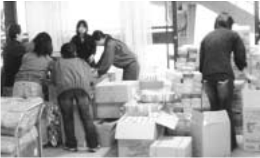
たくさんの救援物資が届きました