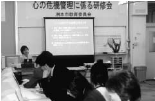
子どもの心のケアのための説明会も行われました