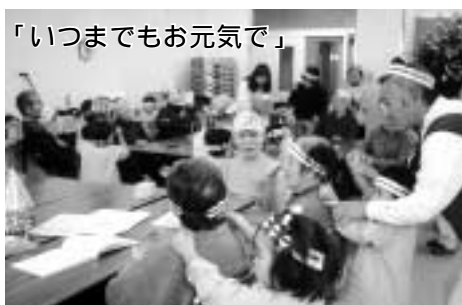
「いつまでもお元気で」