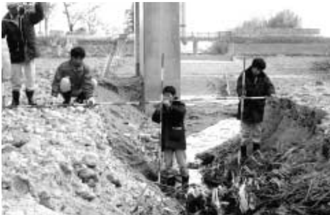
う回路が設置されたり、復旧工事に向けた測量も急ピッチで行われています