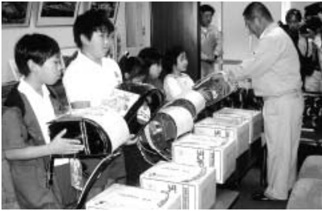
被災地でもある豊岡からランドセルが届きました