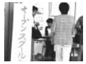
オープンスクール

2日目(10月13日)の親子給食、授業参観、PTA教育講演会には、たくさんの皆さんに来ていただきました。親子給食でおいしい給食に舌鼓を打った後、5校時は総合の発表会です。社会班は「環境問題」をテーマに3年越しで取組み、今年も校門前で「ポイ捨て禁止」のキャンペーン活動を展開しました。