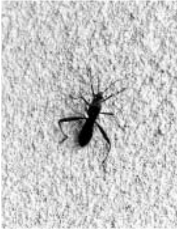
ホソヘリカメムシの成虫