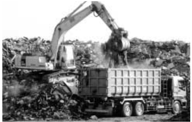
災害ゴミの搬出も始まりました(城戸アグリ公園で)