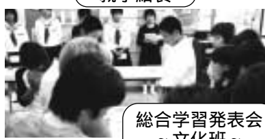
総合学習発表会 ~文化班~