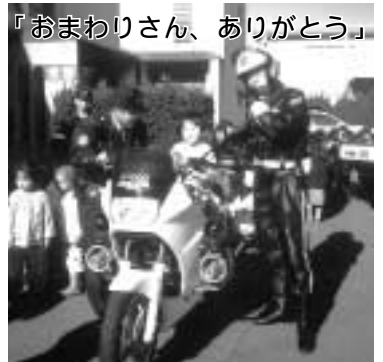
「おまわりさん、ありがとう」