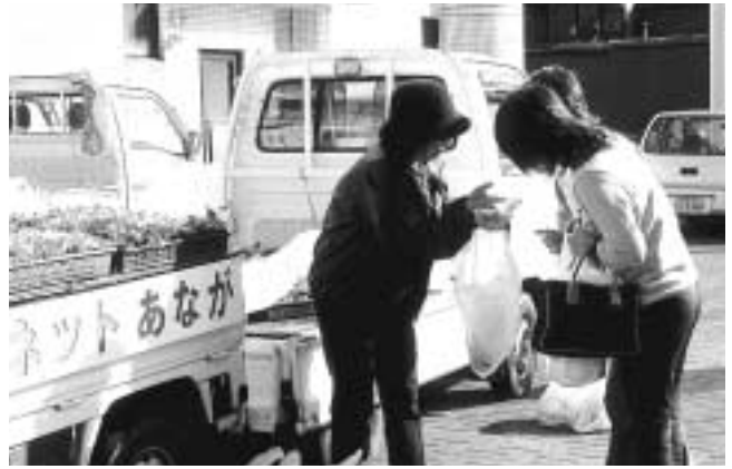
西淡町の花づくりグループから二千株のポット苗が贈られました