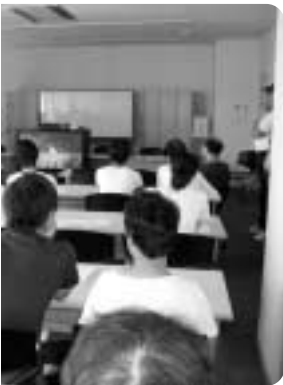
五色地域での研修

兵庫県では五十年ぶりの開催となる「のじぎく兵庫国体」、そして第六回目の開催となる全国障害者スポーツ大会「のじぎく兵庫大会」に先立ち、県下全域で大会旗・炬火リレーが行われます。炬火リレーは、オリンピックの聖火にあたるもので、第五回