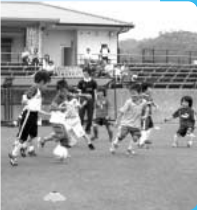
サッカー競技(少年男子)