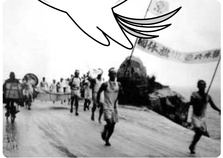
昭和31年洲本市で行われた国体旗リレー