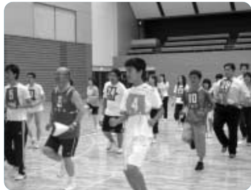
洲本地域での大会旗や炬火の引継ぎ研修

のじぎく兵庫国体洲本市実行委員会事務局 (☎25-3388) のじぎく兵庫国体洲本市五色実行委員会事務局 (☎34-1177)