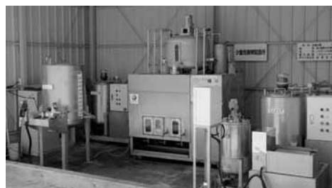
▲廃食用油を精製するBDF精製プラント (ウエルネスパーク五色内)

また精製されたBDFは、公用車の燃料として利用してきました。この取り組みは、合併後に全市域へと拡大し、平成19年度には、約12キロリットルの廃食用油が回収されています。