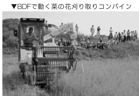
▼BDFで動く菜の花刈り取りコンバイン

プロジェクトをさらに推進するため、平成18年度には、BDFで動く菜の花刈り取りコンバインを導入しました。従来は手刈りや、借り受けたコンバインで作業を行ってきま