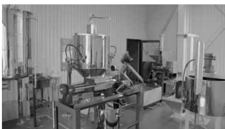
▲3月末に完成した菜種搾油施設 (ウエルネスパーク五色内)

平成19年度には、国などの補助金を活用し、ウエルネスパーク五色の夢工房前に菜種搾油施設を整備しました。これにより、菜の花エコプロジェクトに必要な設備が全て整い、市内で一連のサイクルが完結できるようになりました。