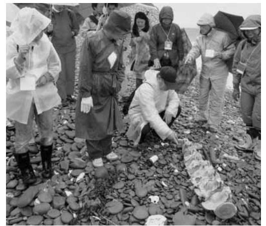
▲海岸に打ち上げられたクジラの骨を観察する参加者

ら移動しました。あいにくの雨の中、ツアー参加者ら約1000人は渡船で島に上陸。成ケ島を美しくする会のメンバーや、ガイド補佐役として参加した由良小学校6年生から説明を受けながら、ウミガメの産卵が確認された海岸や、貴重な海浜植物「ハマウツボ」「ハママツナ」などを観察。また、豊かな自然を汚す大きな原因が漂着ごみであることも学びました。ツアー参加者からは、「大阪、神戸に近い所でウミガメの産卵場所があ