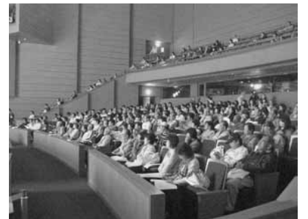
▲熱心に話しを聞く参加者

かわらず、参加者は、講演や報告に耳を傾け、メモを取ったり大きくうなずいたりしていました。