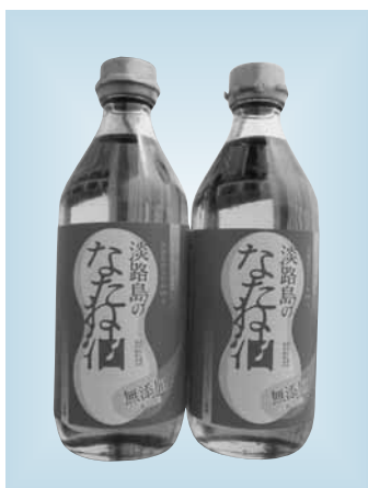
▲販売されている500mlのナタネ油

商品は、ガラス瓶に詰められた500ミリットル入りで780円(本年6月末までは本数限定の500円で販売)。現在、ウエルネスパーク五色「浜千鳥」と、淡路ごちそう館「御食国」で販売しています。また、徳用900ミリットルのほか、土産用としての小瓶、業務用としての18リットル缶の販売も検討しています。