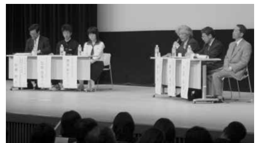
▲パネルディスカッションで意見を交わすパネリスト

私たちにできること」をテーマに、5人のパネリストが討論。「絶滅直前の生物や植物も生息しているのでも今のままでは心配」「自然を守