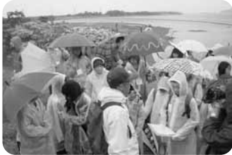
▲エコツアーでガイド補佐役を務める児童