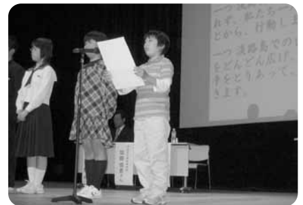
▲シンポジウムで地球環境宣言を読み上げる児童

この日2年生は、これまで島で観察して学んだ動植物の絵を描いたり、折り紙を使って表現するなどしてまとめ、その成果を発表しました。