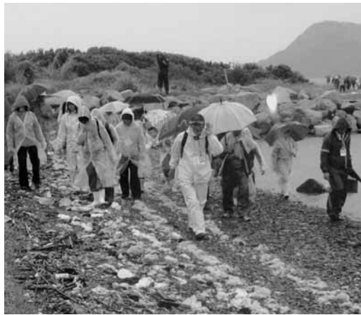
▲漂着ごみの説明を受けながら海岸を歩く参加者

午前中は、自然の宝庫として知られる無人島の成ケ島でのエコツアー。参加者らは、文化体育館前で廃食用油をリサイクルしたバイオディーゼル燃料で走る菜の花バスに乗車。車内では、菜の花バスの仕組みや廃食用油の再利用によって、二酸化炭素の増加が抑えられるなどといった、環境学習を受けなが