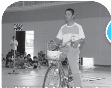
小学校の自転車講習会を手伝いました

生徒たちは、それぞれの場所で普段の学校生活では体験できないことを経験し、社会の仕組みや仕事の厳しさ、やりがいなどを感じたようです。