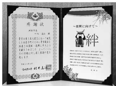
宮城県知事からの感謝状