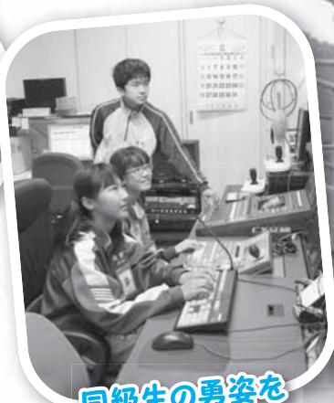
同級生の勇姿を格好良く編集