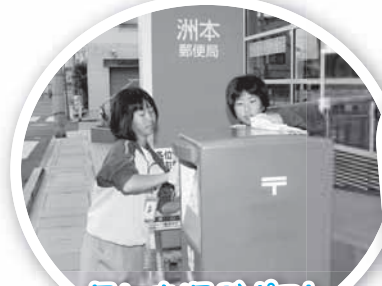
思いを運ぶポストだから、念入りに磨くよ