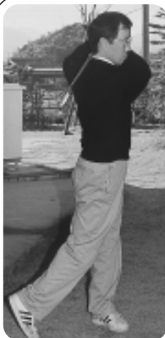
I字型フィニッシュ

冬期はゴルフのシーズンオフ。にもかかわらずゴルフを楽しみたい人は注意が必要です。整形外科的には以下の障害が発生します。