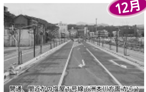
開通、間近かの塩屋1号線(洲本川方面から)

「新都心ゾーン整備構想」に沿って整備が順調に進んでいますが、市道「塩屋1・2号線」が12月20日開通します。