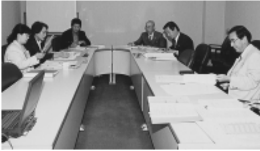
介護認定審査会は専門家で構成され公平に行われます。

答一 要介護認定を申請すると三十日以内に要介護認定結果が通知されます。通知には認定の結果と認定の有効期限のほかに、介護サービスの利用例、介護サービス計画の作成機関である指定居宅介護支援事業所の名簿が同