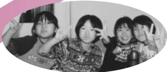
写真の人に出会ったら、広報にのって いたねと、ひと声かけてね。