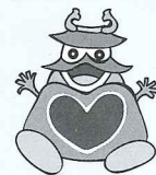
洲本市社会福祉協議会キャラクター みっくマン

特例 転入者が満50歳未満の単身者であっても親世帯に転入し3年以内に婚姻した場合は、転入日より3年間を限度として、当該事業の対象となります。