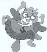
洲本市八狸キャラクター 柴右衛門