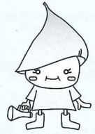
五色町商工会青年部キャラクター イワバちゃん