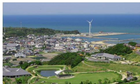
(高田屋嘉兵衛公園)