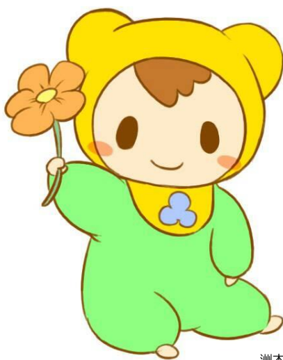
洲本市公式マスコットキャラクター なのは