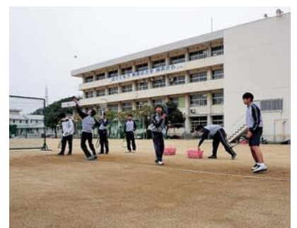
▲学校における部活動の風景