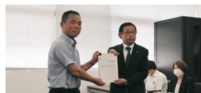
▲第三者委員会からの最終報告

A 基本的な事項であるうがい・手洗いの励行と感染状況によりマスクの着用、保護者には保健だよりなどで啓発活動を実施。 (教育長)