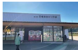
▲道の駅 恐竜渓谷かつやま

勝山市では、観光地域づくり法人(DMO)の勝山市観光まちづくり(株)が観光地域づくりの司令塔として、道の駅などを運営しています。観光の産業化をミッションとして、「地域に落ちるお金を増やす」ことを大切に、さまざまな取り組みをされていました。