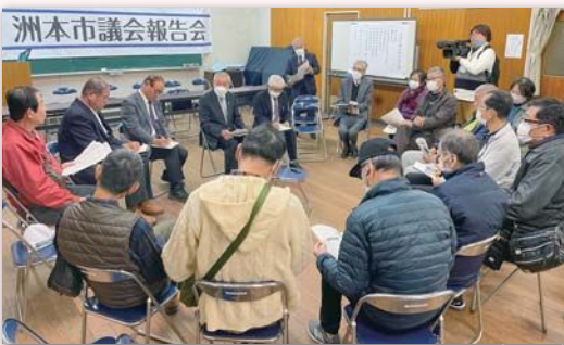
他地区からも参加がありました。