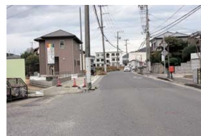
▲改良・拡幅工事が進む市道加茂中央線

A 市民生活に直結する安全・安心のための予算は、できる限り確保を進めていきたい。(市長)