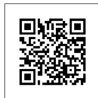
▲サンテレビの報道 (YouTube動画)