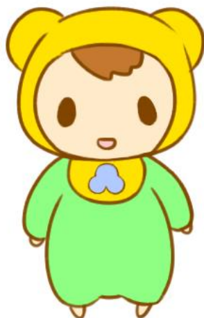
洲本市公式マスコットキャラクター なのは