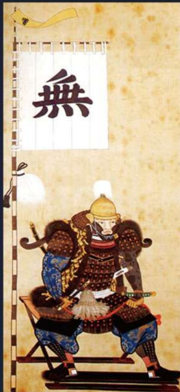
円覚公御画像(仙石秀久肖像) 豊岡市立歴史博物館蔵

今回の特別展では、歴代城主の貴重な資料や発掘調査で出土した瓦など、洲本城500年の歴史を余すことなくご覧ください。