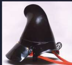
黒塗烏帽子形兜 たつの市立龍野歴史文化資料館蔵