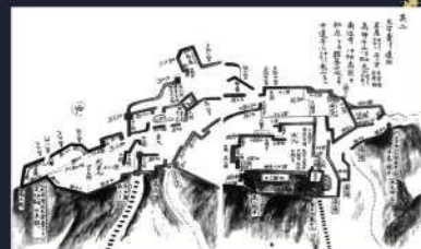
洲本城縄張り図(『味地草』より) 当館蔵