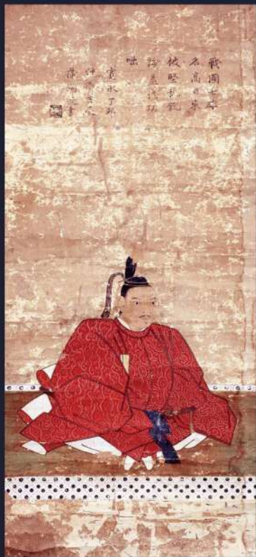
脇坂安治画像 個人蔵