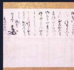
羽柴秀吉書状 広田家文書 個人蔵