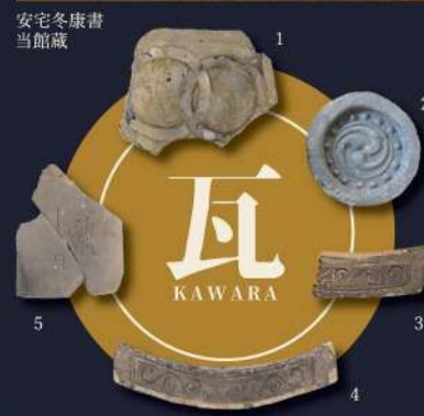
1. 輪違い紋鬼瓦 2. 巴文軒丸瓦 3. 4. 唐草文軒平瓦 5. 文字瓦 / 当館蔵