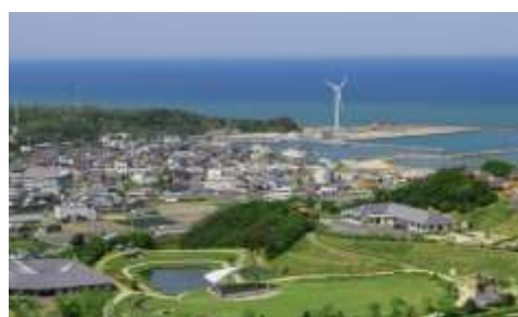
(高田屋嘉兵衛公園)