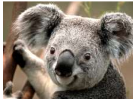
(イングランドの丘)