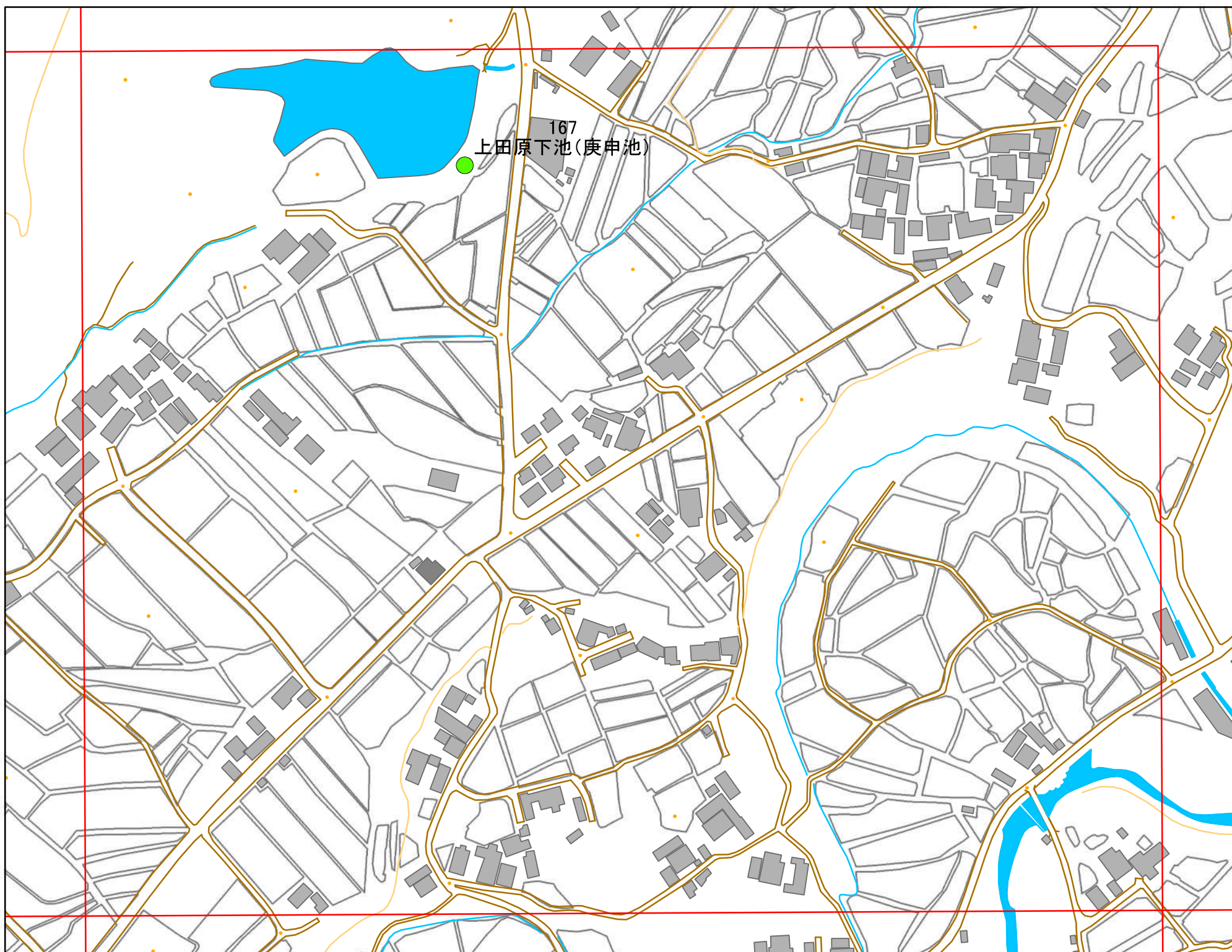
地図内ため池諸元一覧表