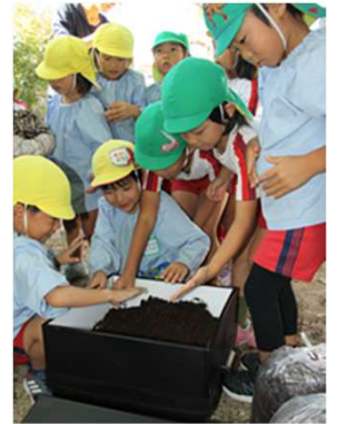
コンポストを組み立てる都志保育所の園児たち