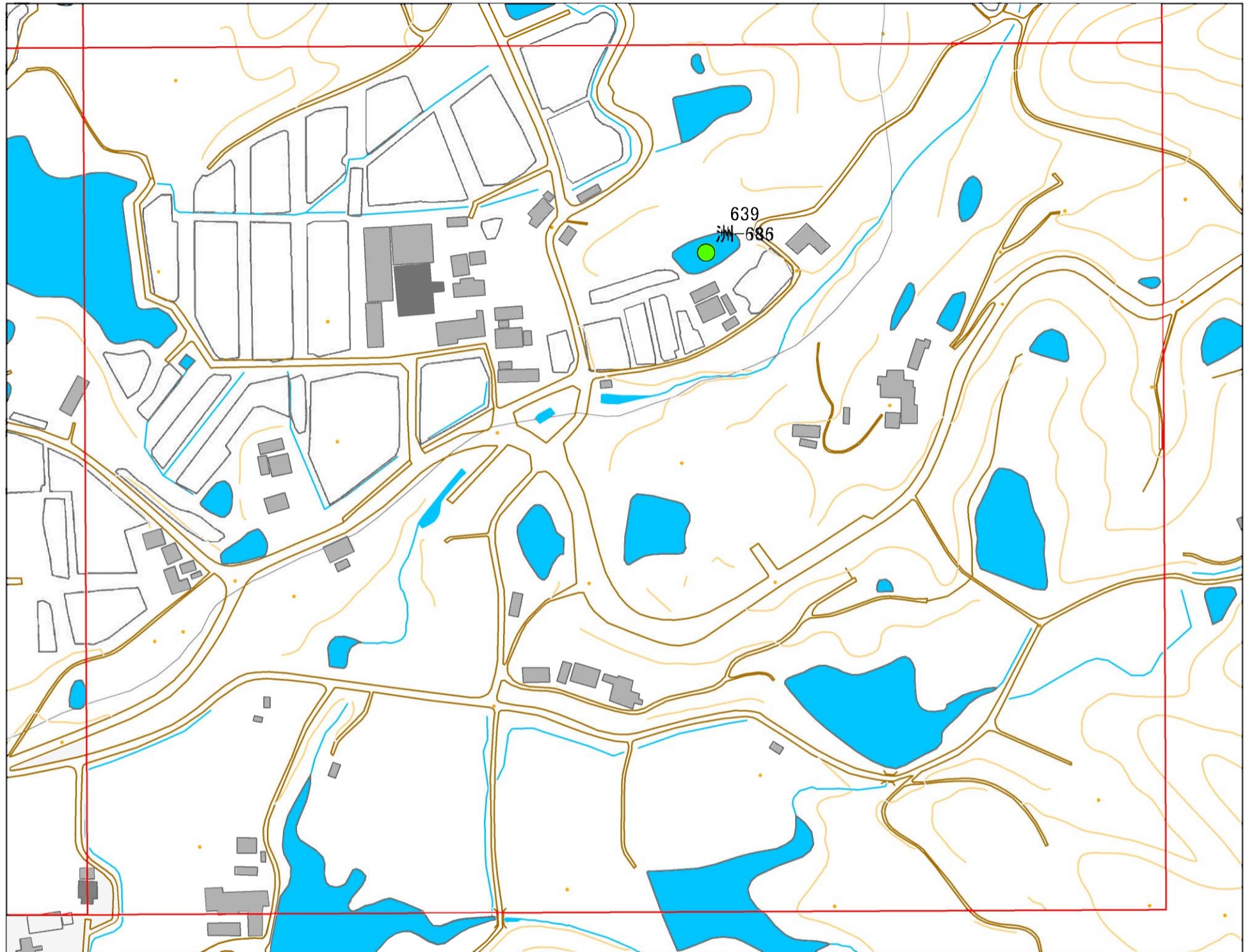
地図内ため池諸元一覧表