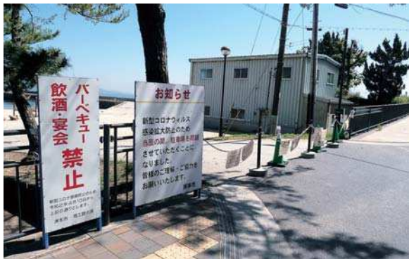
▲閉鎖された大浜公園駐車場入口（今夏の海水浴場は開設中止）