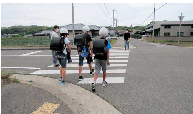
▲友達と一緒に登校する小学生

Q 40人近い学級の対応や健康観察は。本市は、文科省の衛生管理マニュアルでは感染レベル1に該当するので、教室内の換気を十分に行い、これまでより机の間隔をあけて対応している。学校で発熱した場合も、保健室で待機させ安全に帰宅させる。自宅での発熱の場合は出席停止の扱いとなる。(教育長)