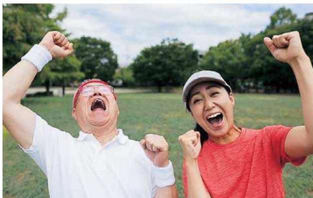
▲アクティブシニア。ずう〜っと青春