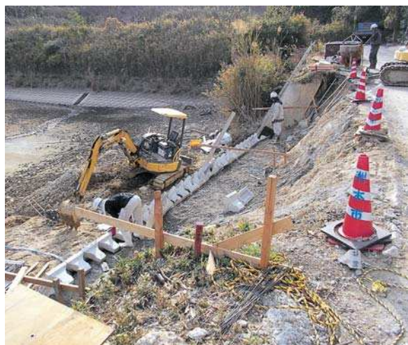
▲災害復旧現場 洲本市建設業協同組合との協定で、災害復旧に対応可能な事業社数は43社。本市入札審査資格者における主要建設機械は226台となっている。

A 期契約制度」の活用は。両制度は工事の平準化に加え、建設業の担い手確保などにもつながると認識しているが、本市では、適正な工事期間の確保や、年間を通じた計画を策定することにより、発注の時期を集中させない取り組みを行っている。