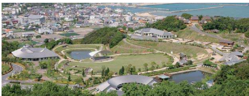
▲重点「道の駅」に選定された高田屋嘉兵衛公園

化を図り、交通システムや物販面での「スマート化」や「五色地域の新たな顔」として魅力的で賑わいのある場所にしたい。（副市長）