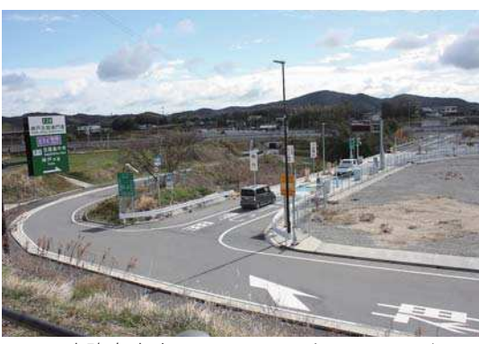
▲淡路島中央スマートインターチェンジ 神戸方面入口付近

A 開通から3年経過したが、周辺の整備や活性化については、実施主体の不在などもあって実現に至っていないのが実情。民間事業者などの新たな動向にも注視しながら地域活性化を検討していく。(企画情報部)