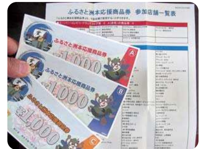
▲昨年配布した商品券

Q 時期や使える店舗は。 A 〔情報部〕 一世帯に額面2万円を配布を予定しており、昨年配布した振興券同様に使用店舗を区分し、7月頃をめどに、書留で送付予定である。