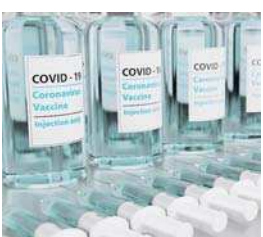
▲新型コロナウイルスワクチン (画像はイメージ)

Q 新型コロナウイルスワクチンの有効性は、ワクチンを受けた人が、受けていない人よりも、発症予防効果が約95%との報告がある。また、十分な免疫ができるのは、2回目の接種から7日程度経過した以降とされる。