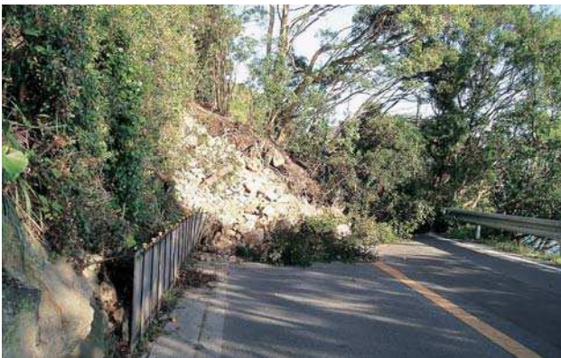
▲掛牛地区の法面崩壊現場

Q 地域を限定したものは、市全体を対象としてさまざまな事業を展開している。暮らしやすい環境を維持する取り組みとして、社会動態面で一定の効果を期待している。