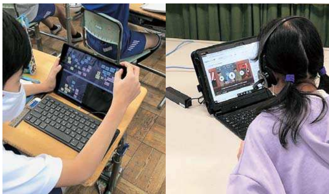
▲変化する児童生徒の情報環境

A 洲本市空家等対策室内連絡会議を設置して関係各課との連絡体制を整えながら相談内容に応じて情報