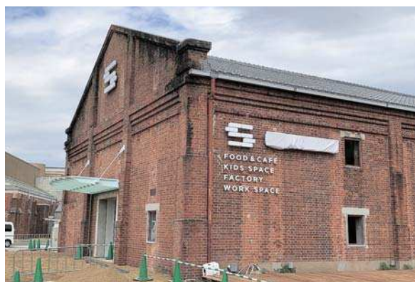
▲リニューアル間近の赤レンガ建物