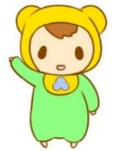
洲本市公式マスコットキャラクター

なお、 洲本市立なのはなこども園の1号認定受入は4歳児・5歳児クラスとなります。