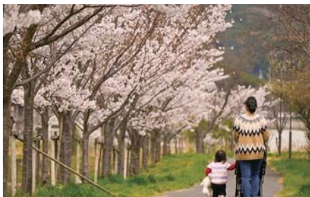
@洲本川(桑間-大森谷橋周辺)