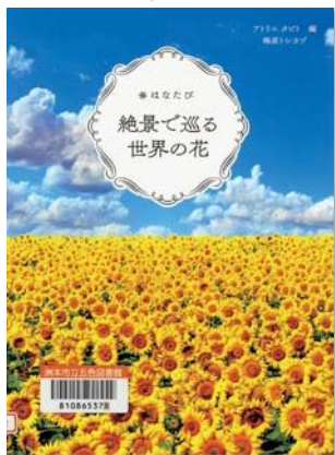
『絶景で巡る世界の花』 編者：アトリエタビト

寒い冬がそろそろ終わり、季節が春に進もうとしている今、美しい花の写真はいかがでしょうか。ウクライナのみまわりやフランスのラベンダーの花畑をはじめ、暮らしと共にある花、祭りやパレードの花など、世界各地の美しい花を写真とエッセイで紹介します。