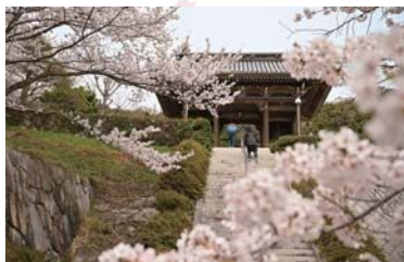
@龍宝寺(五色町鮎原葛尾)