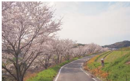
@都志川(五色町鮎原南谷)